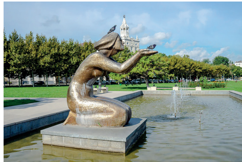
▲ «Дарующая воду», легенда Новороссийска.